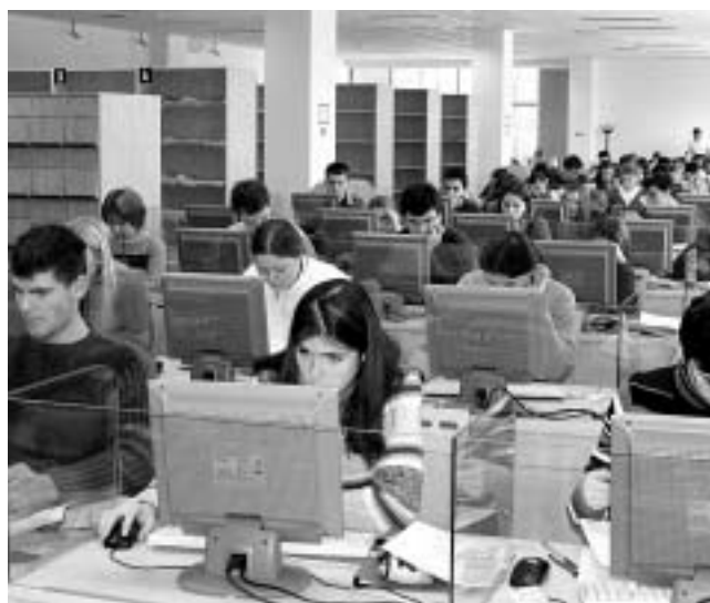
Velká studovna SIC

Ze statistiky za celou univerzitu vyplývá, že stále velká část (84 %) letošních absolventů neměla či nevyužila možnost vycestovat za studiem za hranice České republiky. Zbýlých asi 16 % strávilo v zahraničí jistou dobu – v rozmezí od několika týdnů