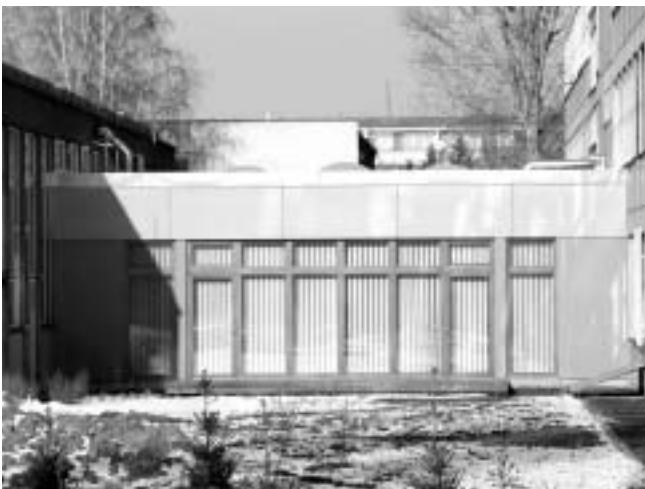
Nová zasedací síň AF

V jednom oddělení je 14 posuvných stolů 1,4m x 4,60 m s napouštěcími ventily. Klimatické zařízení regenerující podmínky ve skleníku je řízeno samostatně. Řídící jednotka dostává signály z čidla meteo-stanice, na základě těchto údajů je řízena teplota, klimatizace, umělé osvětlení a dávkování CO 2 . Řídící jednotky z jednotlivých oddělení jsou vzájemně propojeny v komunikační síti.