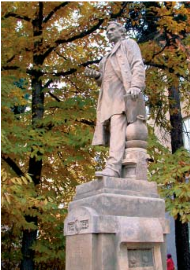
Justus von Liebig