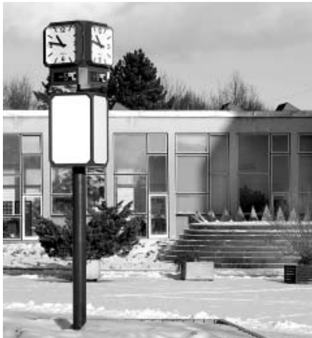
Revitalizace centrálního prostoru ČZU

S ohledem na uvolnění finančních prostředků ze strany MŠMT až v říjnu loňského roku bylo provedeno pouze výběrové řízení na inženýrskou činnost. V lednu roku 2004 bylo vypsané výběrové řízení na projektanta.