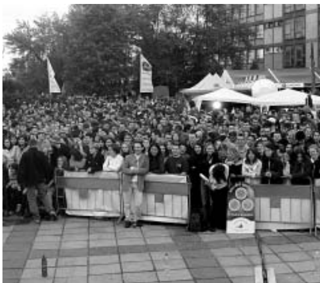
Soutěž Miss Agro

Po intenzivních diskusích se studenty z Humboldtovy univerzity se naskytá celá řada otázek. Jak dalece je důležitá studentská kooperace a solidarita? Proč vytvářet a stále zlepšovat komunikaci mezi studenty a univerzitou? Jednoznačné odpovědi neexistují.