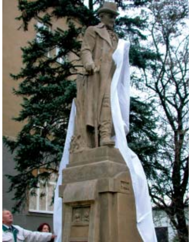
Odhalení sochy Dr. Albrechta Daniela Thaera před Střední odbornou školou služeb a Středním odborným učilištěm v Kadani

V rámci obnovy soch došlo k osobnímu setkání studentů a profesorů Humboldtovy univerzity v Berlíně a České zemědělské univerzity v Praze. Slavnostnímu sobotnímu ceremoniálu předcházela v pátek 7. 11. 2003 mezinárodní studentská konference v budově Střední