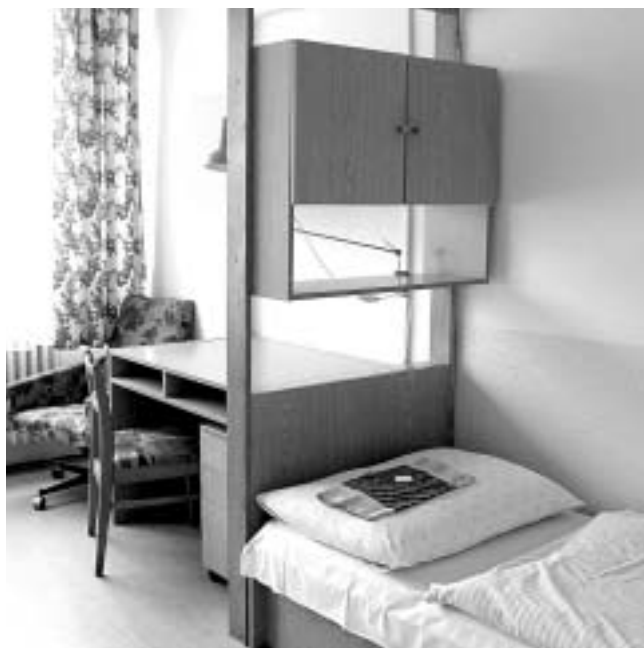
Pokoj na koleji JH