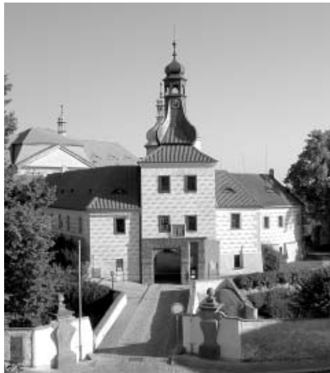
Rekonstrukcí prochází také zámek v Kostelci nad Černými Lesy

Byla provedena kompletní výměna palubové podlahy včetně vodorovné hydroizolace. Akce byla částečně hrazena z grantu magistrátu.