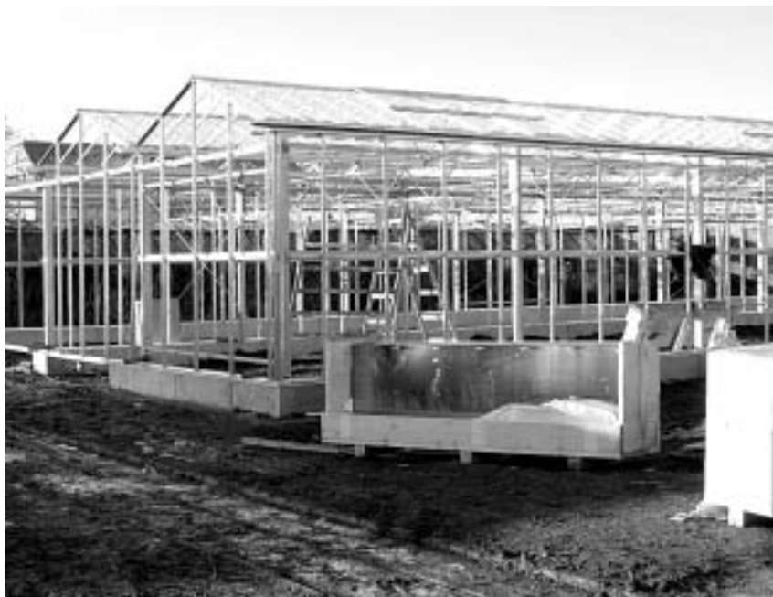
Nová výstavba skleníků

Na základě potřeb fakult a součástí je v současné době zpracováván stavební program dle metodiky Ministerstva školství, mládeže a tělovýchovy ČR. V roce 2004 bude zpracován investiční záměr, který bude předložen na MŠMT k odsouhlasení a zaregistrování.