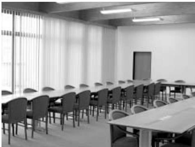
Interiér zasedací síně AF

Provedena kompletní rekonstrukce interiéru a VZT posluchárny.