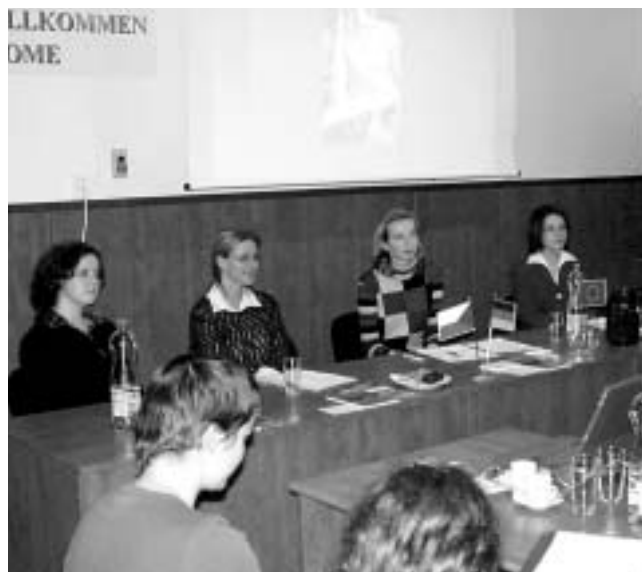
Konference studentů v Kadani

Do univerzitních institucí patří senáty a spolek MOST. Mezi „zájmové“ organizace řadíme SPODEK, IAAS, AISEC aj. Proč pojmenování zájmové? I když jsou tyto spolky nedílnou součástí uni-